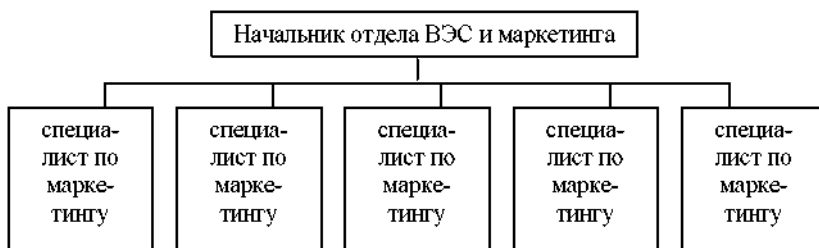
Рисунок 3 – Схема структуры управления отдела внешнеэкономических связей и маркетинга

Схема структуры управления такого объединенного отдела имела бы следующий вид (рис. 3).