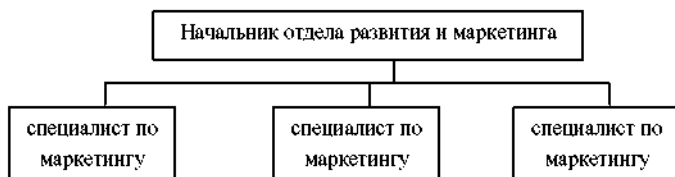
Рисунок 1 – Схема структуры управления отдела развития и маркетинга