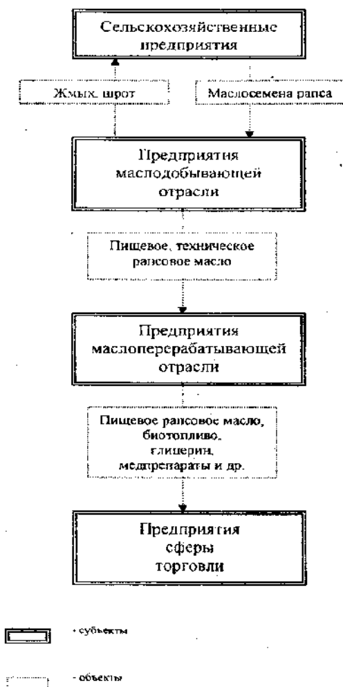
Рисунок 2 – Система взаимосвязей субъектов и объектов рынка рапсового сырья

Другими словами, интеграция должна проходить на основе обеспечения технического, технологического, экономического единства и