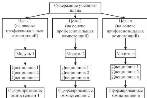
Рисунок 2 - Модульный подход в рамках учебного плана

Третий уровень, на много шире предыдущего уровня. На этом уровне модульная система обучения связывает все дисциплины учебного плана в отдельные модули. Здесь уже предусматривается формирование академических, социально-личностных и профессиональных компетенций (в соответствии требованиям образовательного стандарта). В современных Белорусских учебных планах что-то подобное имеется, а модули дисциплин называются циклами («Цикл социально-гуманитарных дисциплин», «Цикл естественнонаучных дисциплин», «Цикл общепрофессиональных и