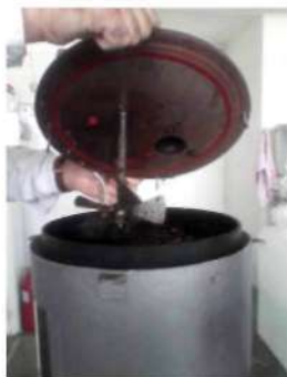
Рисунок 1 – Лабораторная биогазовая установка

Результаты исследований и их обсуждение. Анаэробное сбраживание семян осота полевого и подорожника ланцетолистного в лабораторной биогазовой установке при температуре 30-35 o С оказало достоверное влияние на изменение жизнеспособности семян в зависимости от времени экспозиции (таблица 1).