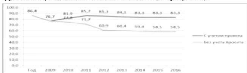
Рисунок 2 – Динамика уровня безубыточности. %

В ходе реализации программы по производству новых продуктов уровень безубыточности снизится до 58,5% (см. рисунок 2).