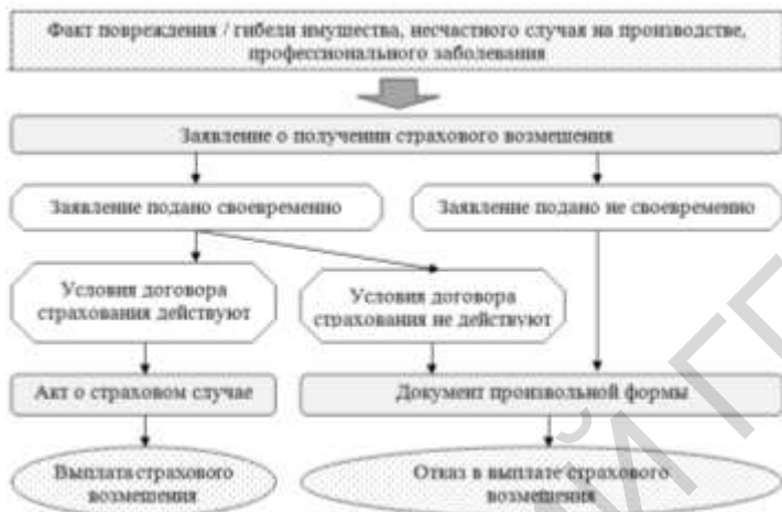
Рисунок 3 – Алгоритм действий при наступлении страхового случая

Примечание – Источник: собственная разработка на основании нормативно-правовых актов [7, 8]